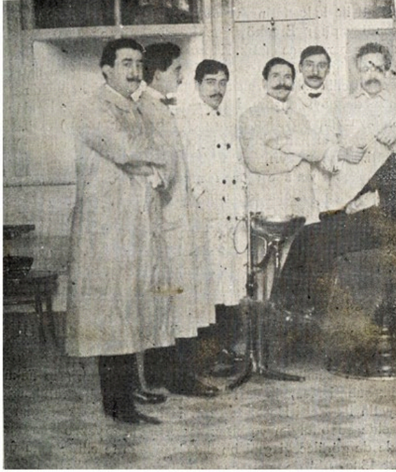
Halit Şazi Dişçi Mektebi kliniğinde hasta bakarken. Büyükaksoy ZC. Türk Dişhekimliği Tarihi . Türk Diştabipleri Cemiyeti Albümü, Hüsnütabiat Basımevi, İstanbul, 1951. s 439.

24 Nisan 1897’de Yunan Savaşı başlayınca askerlik görevine çağırılmış ve Alasonya’ya (Yunanistan’da bir kasaba) gönderilmiştir. 13 Kasım 1898’de sol kolağalığına (yüzbaşı ile binbaşı arası bir rütbe), 28 Kasım 1902’de sağ kolağalığına terfi etmiştir. Burada hastalanınca geri dönmüştür.